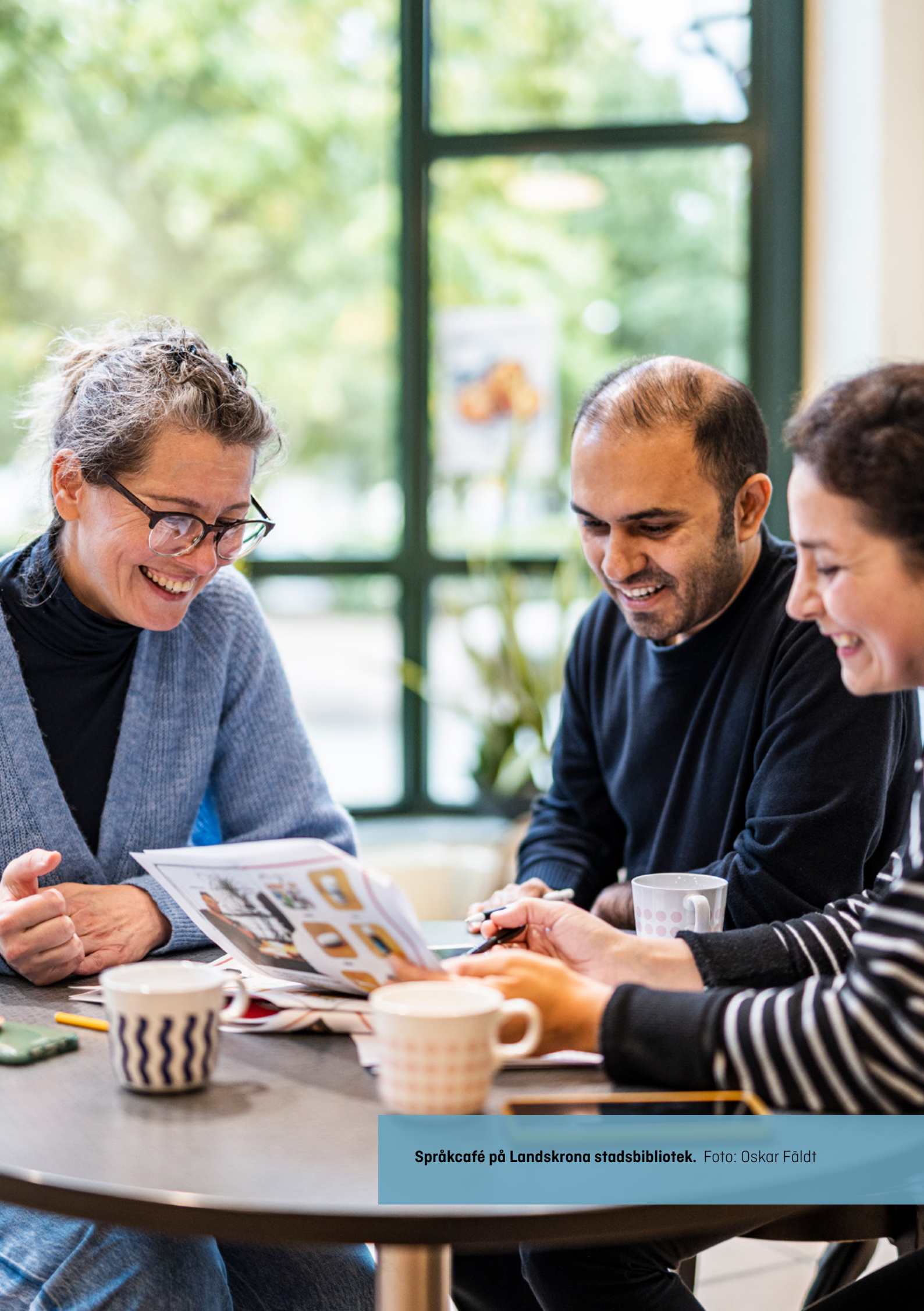
Språkcafé på Landskrona stadsbibliotek.