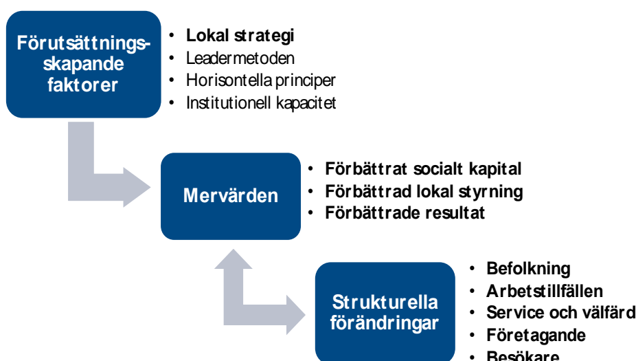
Figur Förutsättningar ger Mervärden som ger Effekter (strukturella förändringar)

Leader Bohuskust har varit del i arbetet med Lärande och Innovationsprojektet som har handlat om hur man får bättre effekter av leaderprojekt. Nedan följer planen för hur Leader Bohuslän kommer arbeta med frågorna. Men först lite om effekter.