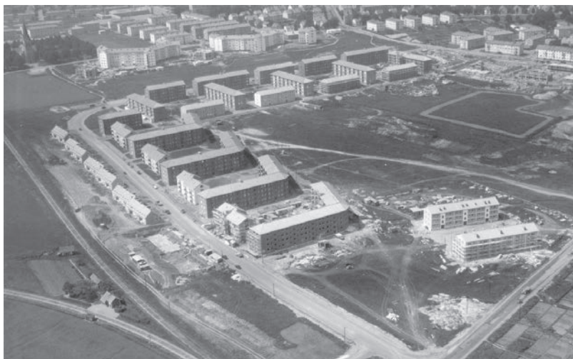
Ljura under uppbyggnad under slutet av 1940-talet.

Ljura var det första området i Norrköpings som planerades efter de nya planeringsprinciper som blev vägledande för det stora bostadsbyggande som startade i mitten av 1900-talet. Stor enhetlig bostadsbebyggelse med en sida ut mot trafik och parkering och en sida in mot bilfria innergårdar och park. Eftersom hyreslägenheterna i Ljura bara hade små lägenheter minskade befolkningen över tid när bostadspreferenserna ändrades och inte längre fungerade för barnfamiljer. På 1980-talet kompletterades därför området med större lägenheter i den nordöstra delen av området.