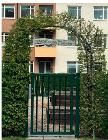
Stadsodlingen Magnolia finns på två innergårdar i Ljura

Stadsdelsparken i Ljura och de gröna innergårdarna utvecklas så att de tydligare kompletterar varandra och erbjuder en mångfacetterad grön miljö med många olika mötesplatser samt anläggningar för fysisk aktivitet och rekreation. Innergårdarna är till för de boende i första hand och har individuella karaktärer. Fler innergårdar utvecklas med individuella gröna teman. Odlingsmöjligheter i parken tillskapas för flera, inte bara för de som bor i Ljura.